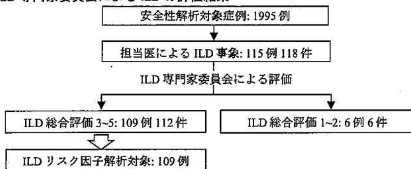
図2：ILD専門家委員会によるILDの評価結果

安全性解析対象1995例のうち、担当医によりILD事象と報告された115例118件についてILD専門家委員会において評価を行った結果、総合評価は、「1：明らかにILDでない」が0件、「2：おそらくILDでない」が6件、「3：ILDの可能性を否定できない」が6件、「4：ILDの可能性はある」が40件、「5：ILDである」が66件でした。1例2件のILDが発現（再投与によるILD再発）した3症例については、それぞれの事象はいずれも5と評価されました。以下ILDリスク因子の解析につきましては、ILD専門家委員会にて総合評価3以上と評価された109例をILD発現症例としました。（図2参照）。